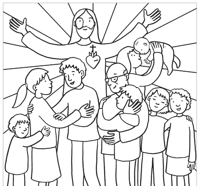
© Laetitia Zink - Mon livre de coloriages pour la messe © Éditions Emmanuel