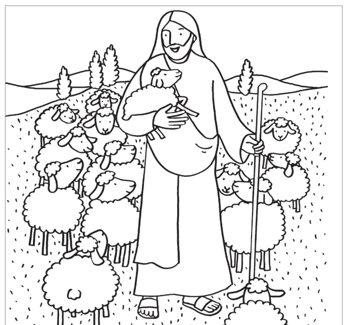
© Laetitia Zink - Mon livre de coloriages pour la messe © Éditions Emmanuel